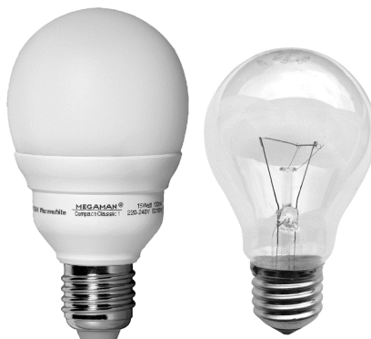
LED-lamp en gewone gloeilamp

Inez kan de hengellamp met de LED-lamp met grotere massa op verschillende manieren weer in evenwicht brengen.